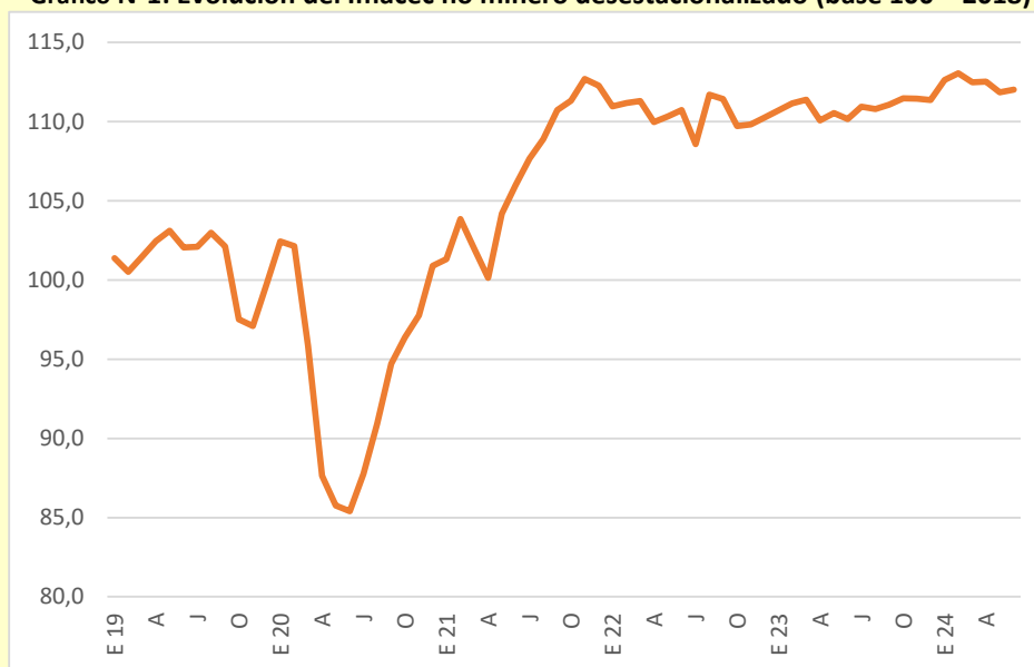
Gráfico N°1: Evolución del Imacec no minero desestacionalizado (base 100 = 2018)