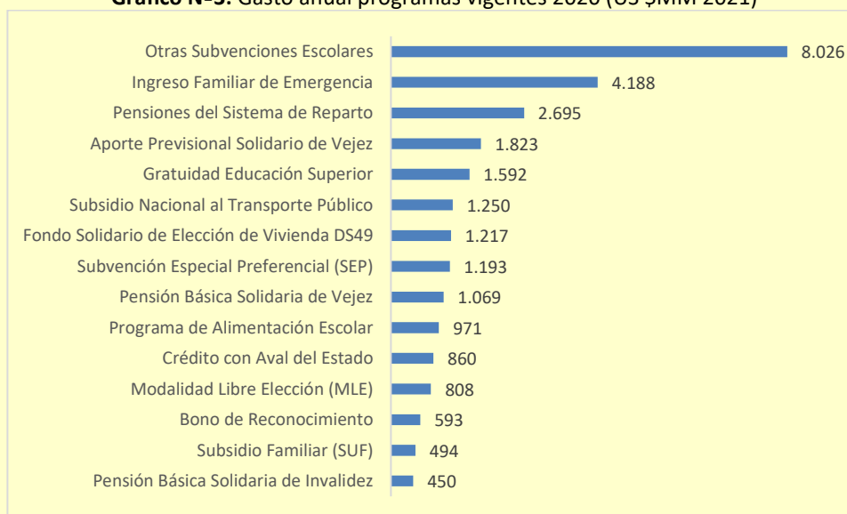
Gráfico N°3: Gasto anual programas vigentes 2020 (US $MM 2021)