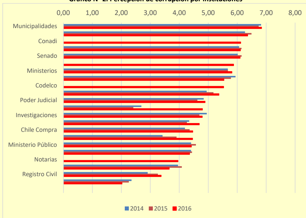
Gráfico N° 2. Percepción de corrupción por instituciones