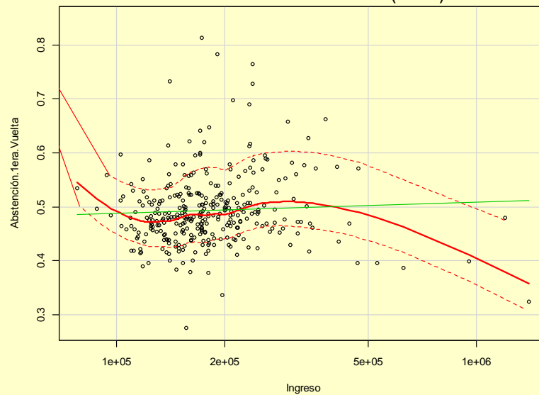
Gráfico N° 2 ABSTENCIÓN COMUNAL EN 1° VUELTA VERSUS INGRESO AUTÓNOMO COMUNAL (LOG)