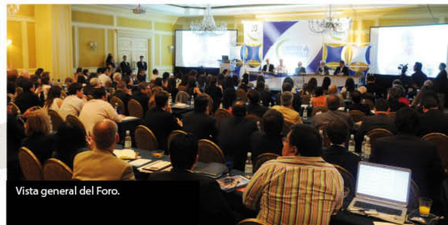
Vista general del Foro.