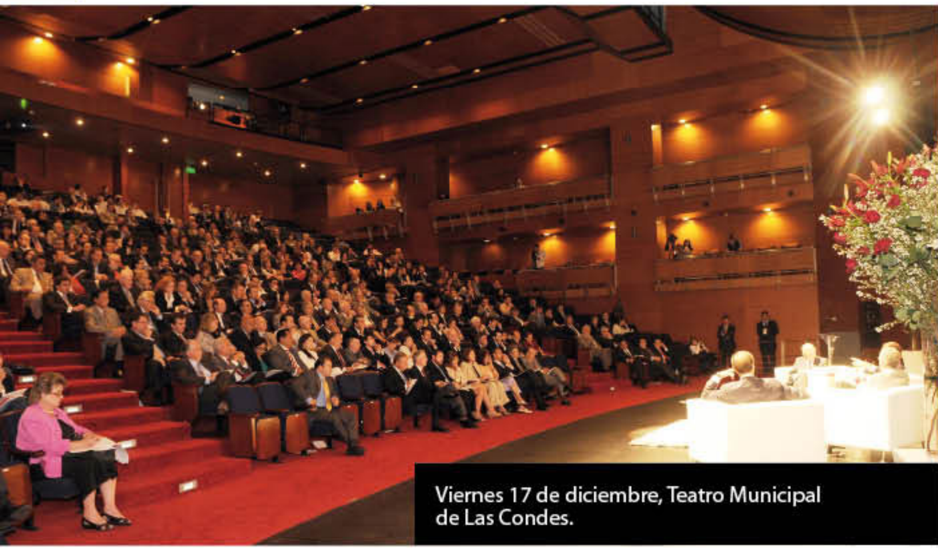
Viernes 17 de diciembre, Teatro Municipal de Las Condes.