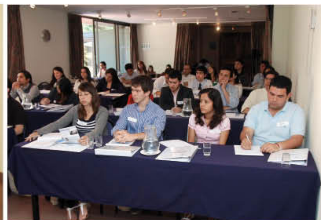
Vista general de los jóvenes asistentes a la Universidad de Verano.