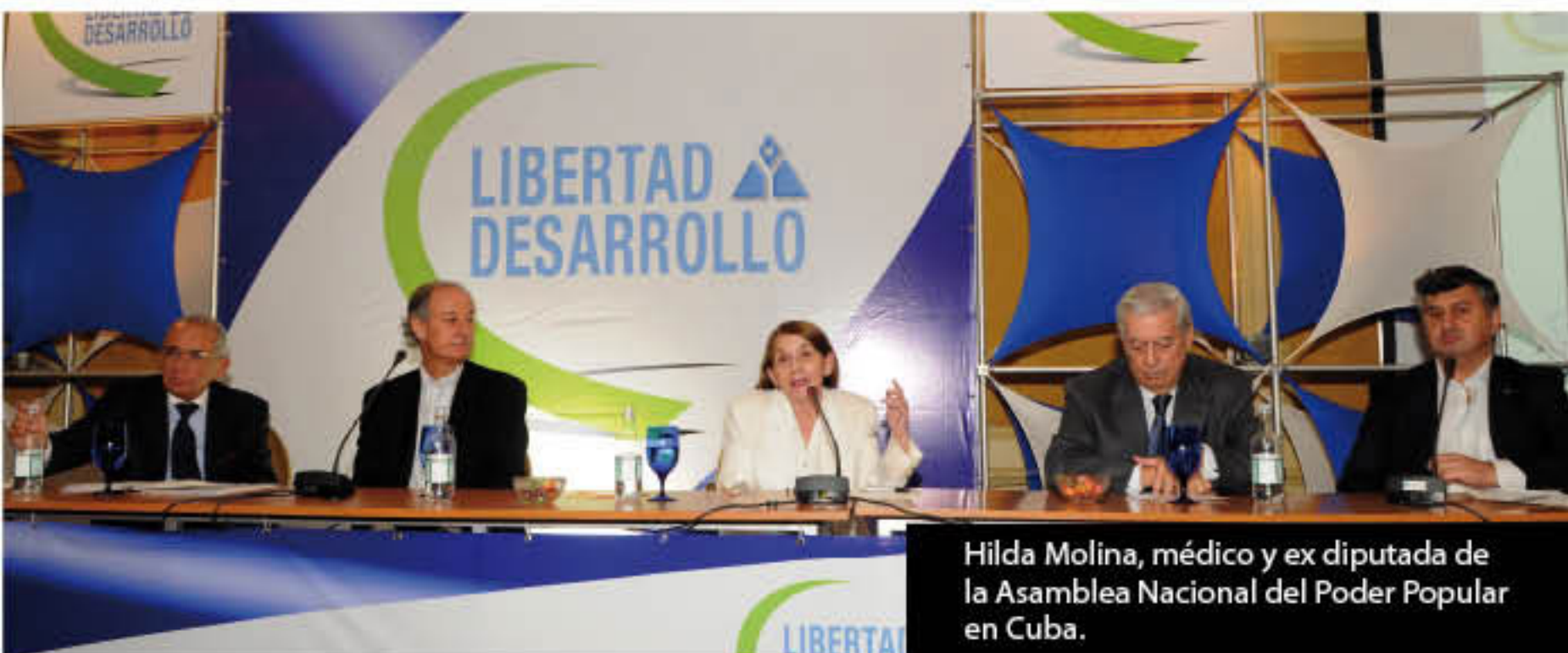
Hilda Molina, médico y ex diputada de la Asamblea Nacional del Poder Popular en Cuba.