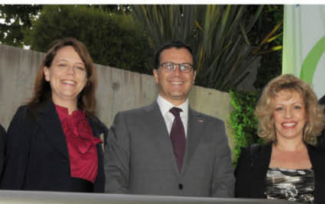
Ena Von Baer, Rodrigo Hinzpeter, ministro del Interior, y Catalina Parot, ministra de Bienes Nacionales.