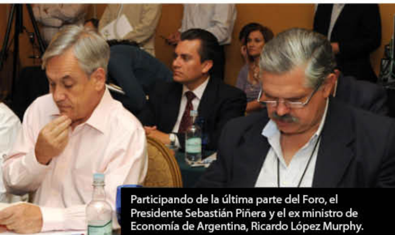
Participando de la última parte del Foro, el Presidente Sebastián Piñera y el ex ministro de Economía de Argentina, Ricardo López Murphy.