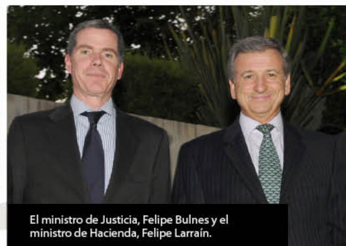
El ministro de Justicia, Felipe Bulnes y el ministro de Hacienda, Felipe Larraín.