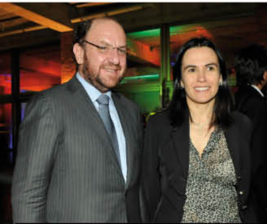
El ministro de Relaciones Exteriores, Alfredo Moreno, y la ministra del Trabajo, Camila Merino.