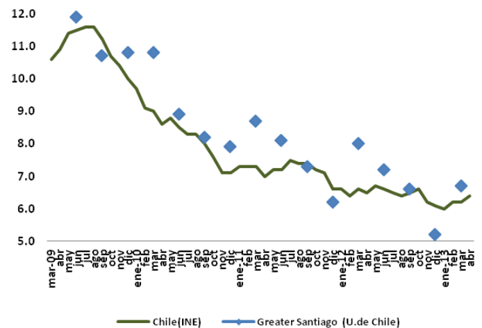
TASA DE DESOCUPACIÓN Como % de la Fuerza de Trabajo

Respecto del trimestre móvil anterior, la fuerza de trabajo aumentó un 0,5%, mientras los ocupados sólo lo hicieron en un 0,3%, lo que explica el aumento de la aún positiva tasa de desocupación.