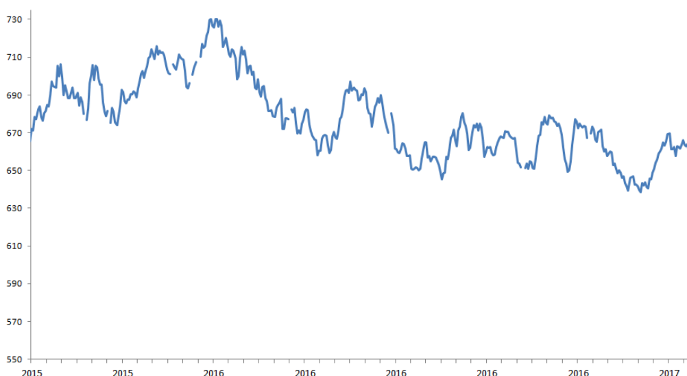
TIPO DE CAMBIO NOMINAL (pesos por dólar, promedio observado diario)

Así, los indicadores subyacentes, aquellos que excluyen los productos más volátiles -como alimentos y energía- y que por lo general tienden a entregar una idea más clara del comportamiento de tendencia, también se han moderado en línea con esta economía poco dinámica, y un mercado laboral ya en franco deterioro. Lo anterior, pese a que muchos precios en nuestra economía siguen teniendo bastante inercia como lo ilustran los arriendos o los servicios educativos, lo que suele retardar el proceso de convergencia y se refleja, por ejemplo, en el IPC de No Transables que aún supera el 3%. En cuanto a las cifras concretas para estas medidas de inflación subyacente, el IPCX, que excluye combustibles, frutas y verduras frescas, experimentó un 0,3% de variación respecto al mes anterior, al igual que el IPCX1, que corresponde al IPCX menos carne y pescados frescos, tarifas reguladas de precios indexados y servicios financieros. Como resultado de lo anterior, en términos interanuales la inflación subyacente, IPCX, disminuyó 0,1 puntos con respecto al mes previo, alcanzando un 2,2% interanual, mientras que el IPCX1 disminuyó 0,2 puntos llegando a un 2,3%. El IPC SAE, que excluye alimentos y energía, y que es uno de los indicadores más seguidos a nivel internacional, se mantiene en 2,2%.