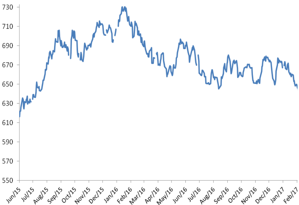
TIPO DE CAMBIO: PESOS POR DOLAR (USD/CLP)

Ahora, si bien en un comienzo la menor inflación parecía más bien responder totalmente a la apreciación del peso, reflejada únicamente en el sector transable, hoyes cada vez más claro que el sector no transable –por ejemplo los servicios- estarían contribuyendo aunque bastante más lentamente, lo que nos recuerda la alta indexación que nuestra economía aún tiene.