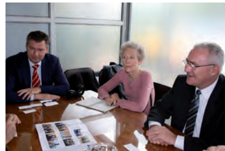
Parte de la delegación austríaca que fue recibida en LyD.